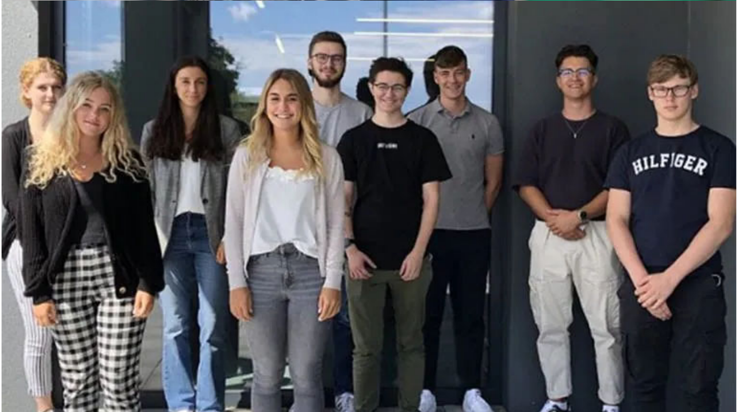
Die Azubis der MarkenTechnikService GmbH in Rülzheim (Kreis Germersheim)